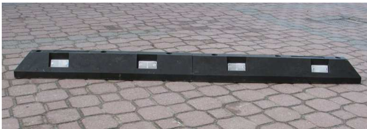
Ogranicznik – zdjęcia poglądowe